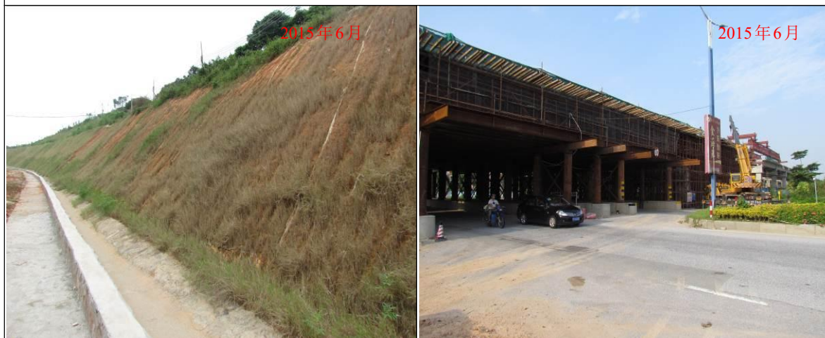
辅道左侧开挖边坡喷播草籽绿化