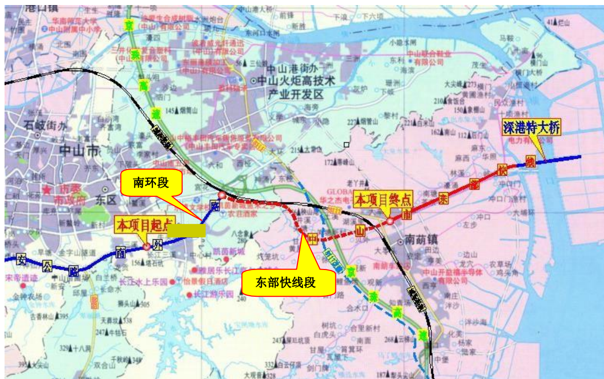
图 1-1 本工程地理位置图

中山市东部快线工程（K40+110.9~K50+022.500 段）位于中山市，项目起点位于中山市东区南外环路，沿南外环路向东经火炬开发区、新时代社区，在广珠轻轨南侧并行通过，路线进入南朗镇后，终点与中山市东部快线工程第二合同段（中山市东部快线工程深港大桥及其引道工程）起点顺接，路线全长 9.91km。项目地理坐标处于东经 113° 25′ 14″ ~112° 31′ 40″，北纬 22° 29′ 42″ ~22° 30′ 23″ 之间。