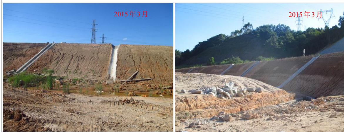
主线路基纵坡面设置临时砂浆抹面急流槽及永久浆砌石急流槽