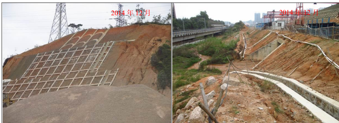
高边坡分级防护，实施拱形浆砌石及钢筋锚索格构梁护坡；路基修筑浆砌石排水沟